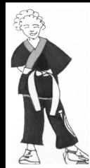
VIZATIM IM, I NJËRIT PREJ BINJAKËVE DISA DITE ME PARË...