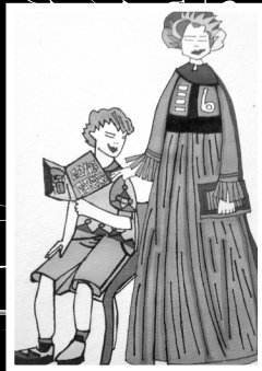
VIZATIM IM, I GJYSHES SË FANIT DHE NJËRIT PREJ BINJAKËVE PESË VJET MË VONË...