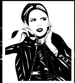
MAMI I EMIT NË TELEFON...